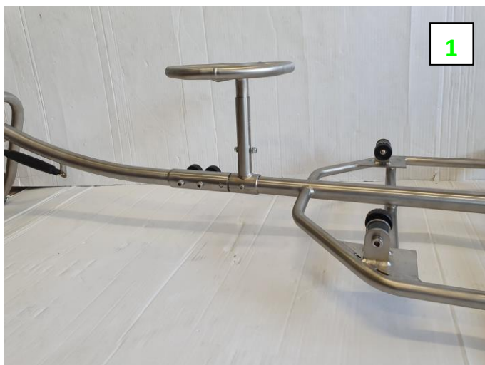
Découpe de la base du tube de support de siège avec une incision dans la longueur