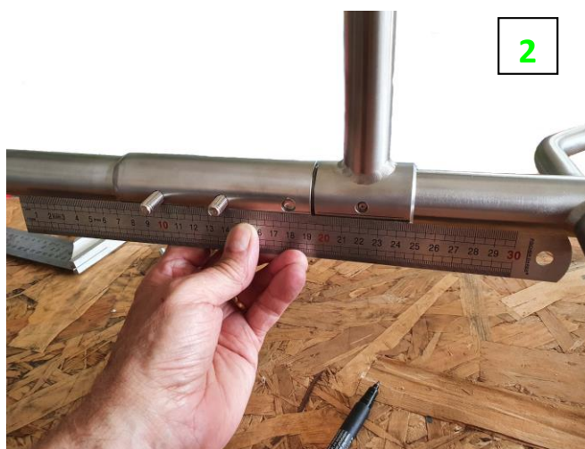
Ecartement du support pour emboîtement sur le tube central